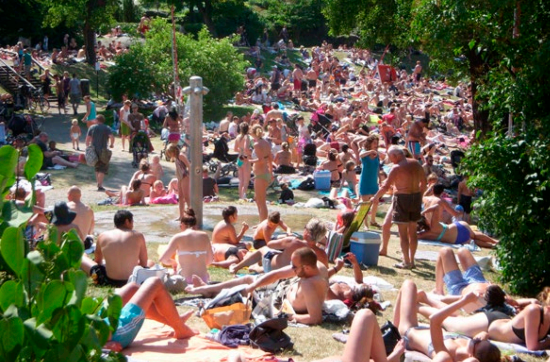
Långholmsbadet, Stockholm.