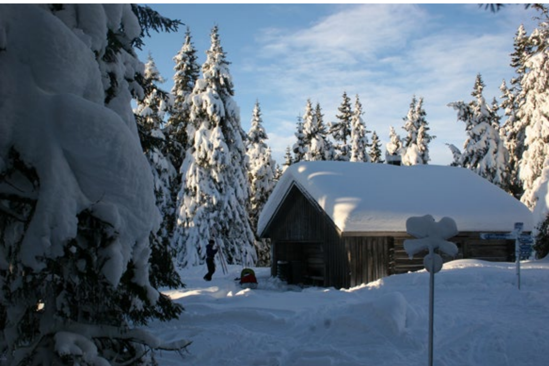
Mellanfjällstugan, Transtrand.